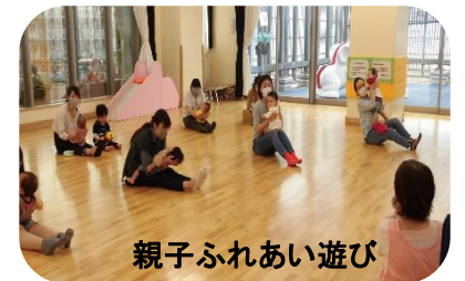
親子ふれあい遊び