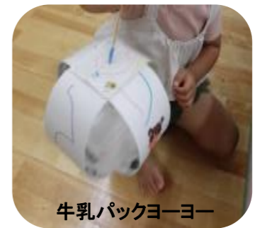
牛乳パックヨーヨー