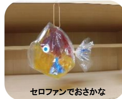
セロファンでおさかな

セロファンのおさかなや牛乳パックのヨーヨーを作りました。いろいろな体験ができるよう、9月も楽しい工作を用意します。おたのしみに! (土日でもできます)